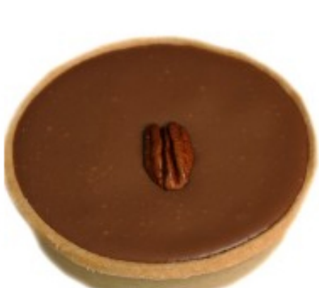
Tarte Noix de Pécan