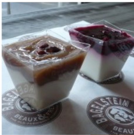
Verrines Fromage blanc