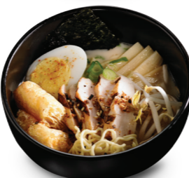
Tonkotsu poulet grillé