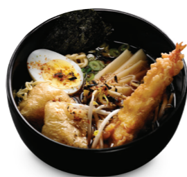
Shoyu crevette tempura