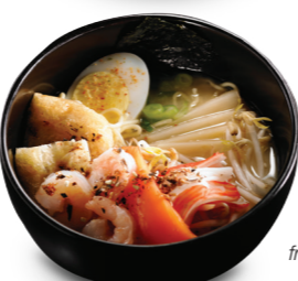
Miso fruits de mer