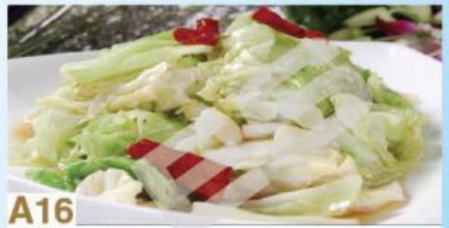
A16 Chou sauté nature épicé Hand-Shredded Cabbage