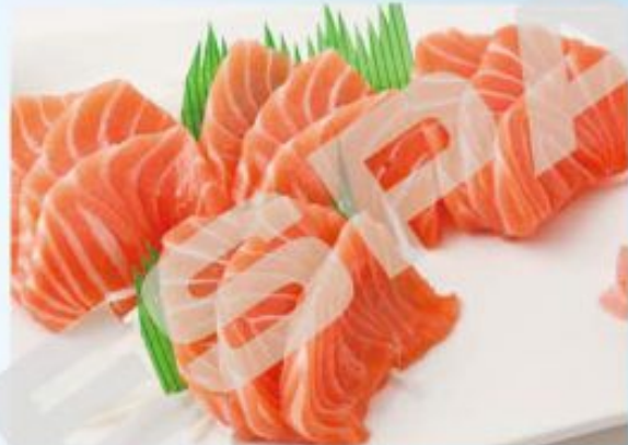
LUNCH BOX 4 .....13,80€