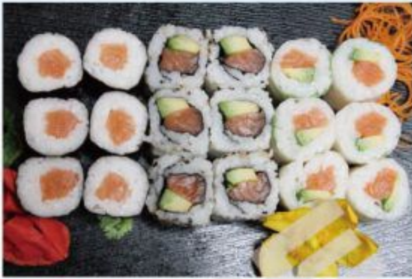
LUNCH BOX 1 .....13,80€

Toutes les lunch box sont avec 2 accompagnements parmi : Soupe miso, salade au chou, salade de fruits, riz vinaigré