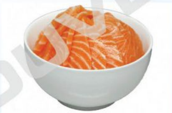
LUNCH BOX 5 .....13,80€