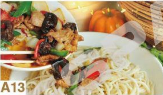
A13 Nouilles à la viande (boeuf, légumes, nouilles fait main)