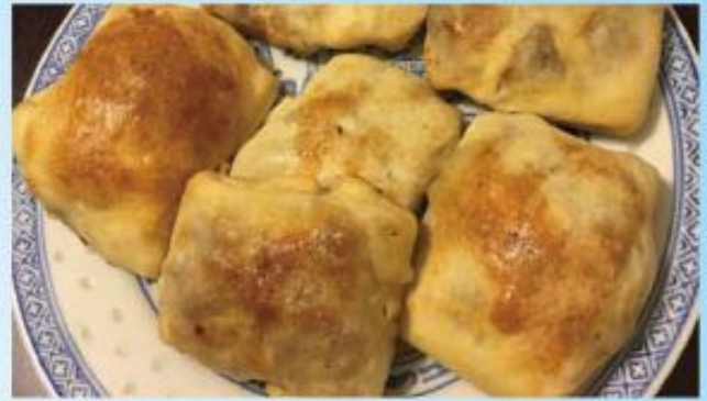
A12 Shamusha Xinjiang baked buns