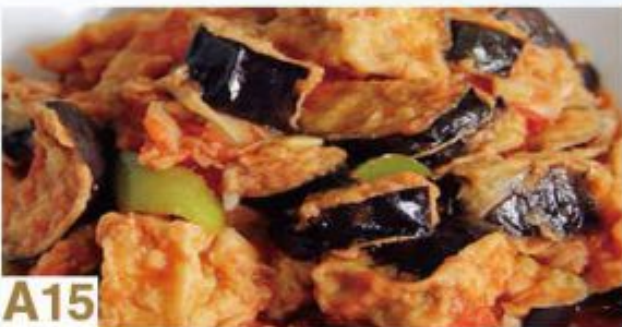
A15 Aubergine braisée rouge Aubergine braised in brown sauce