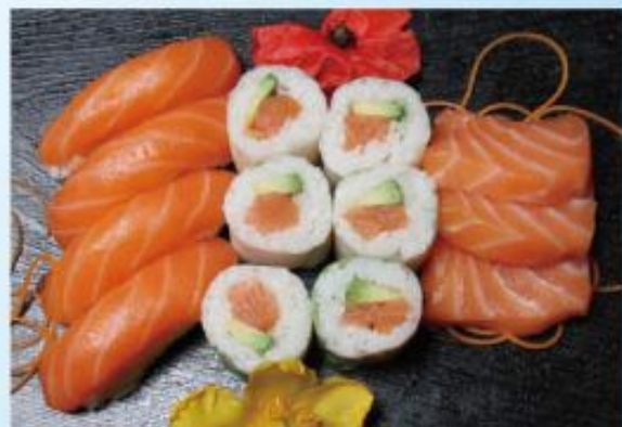
LUNCH BOX 6 .....13,80€

SPRING ROLL Saumon avocat (6 pièces) SUSHI Saumon (4 pièces) SASHIMIS Saumon (3 pièces)