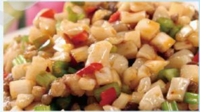
A14 Nouilles Tintin (boeuf, légumes, nouilles fait main)