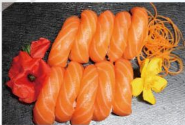
LUNCH BOX 3 .....13,80€

CALIFORNIA Saumon avocat (6 pièces) SUSHI Saumon (6 pièces)