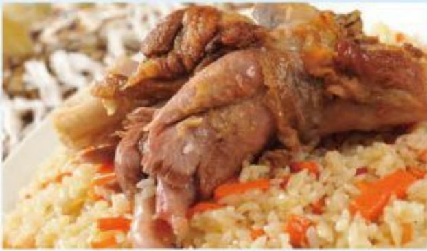
A11 Xinjiang Pilaf (riz, carotte, poulet ou agneau)